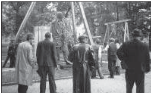
První odstranění sochy 25. června 1940

Spolu s tímto listem však již přišel na zdejší magistrát prostřednictvím rakovnického okresního úřadu přípis ministerstva vnitra, který ukládal odstranění symbolů bývalých státoprávních poměrů. Výnos Prezidia ministerstva vnitra 18. července 1940 ještě doplnilo nařízení tohoto znění: „ Dodatkem ke zdejšímu výnosu ze dne 16. června 1940 [...] se sděluje, že jest co nejrychleji z veřejností odstraniti veškeré pomníky, obrazy, pamětní desky a všechny jiné upomínky na T. G. Masaryka. Pod veřejností rozuměti jest nejen ulice, náměstí a sady, ale také všechny občanstvu přístupné prostory, úřadovny (služebny), školy apod. Při pomníku samém nerozho-