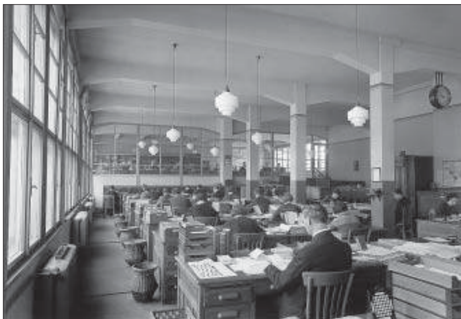
Kancelářské prostory v administrativní budově v r. 1935