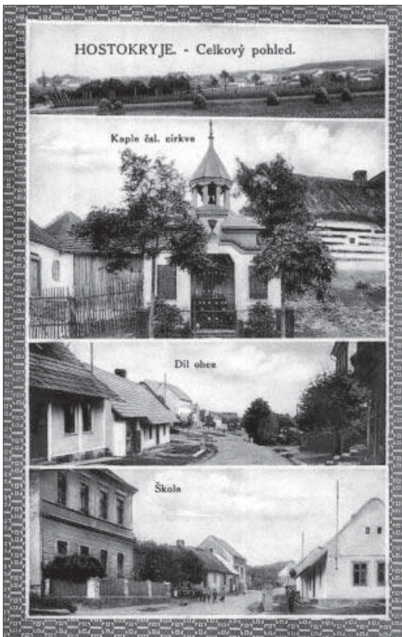
Pohlednice Hostokryj z období první republiky (Obecní úřad Hostokryje)