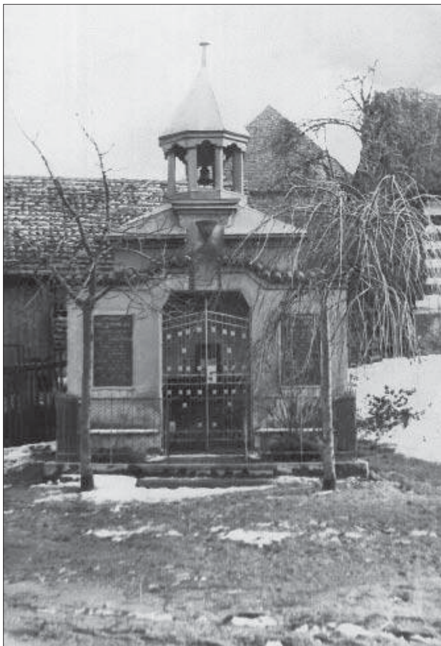
Snímek hostokryjské kaple zhotovený jen několik let po vzniku objektu (Obecní úřad Hostokryje)