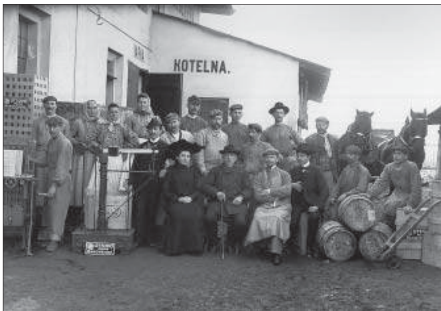
Třicáté výročí založení firmy – r. 1905 (SOka Rakovník)

„Na novém místě šla nám práce daleko lépe od ruky. Nebylo tam zle o kousek místa a mohli jsme si výrobu lépe uspořádat. Starostí ovšem bylo stále dost a dost. Nebyl jsem ještě dlouho v nové dílně, když si přišel za mnou soused stěžovat, že na jeho poli zrovna vedle naší dílny všechno obilí zežloutlo sodovými parami, unikajícými z našeho závodu. Věděl jsem, že je v právu, a hleděl jsem po dobrém nějak věc s ním urovnat. Nabízel mi, abych jeho pole najal – ale já se rozhodl raději je koupit. A dobře jsem udělal! – To pole se mi krásně hodilo, protože zanedlouho jsem musil dále závod rozšiřovat. – Skoupil jsem brzy i ostatní pozemky okolo, protože závod rostl a rostl a musel jsem pamatovat na to, kam budu přistavovat později.“ 30)