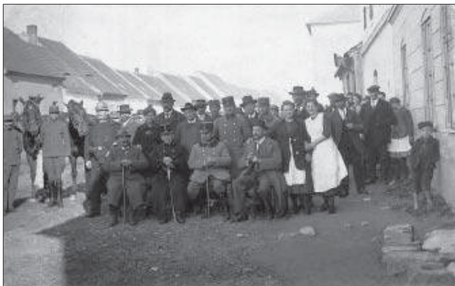
Odvod koní v Palackého ulici před čp. 40 – duben 1918 (MMNS, č. přír. 57/89)