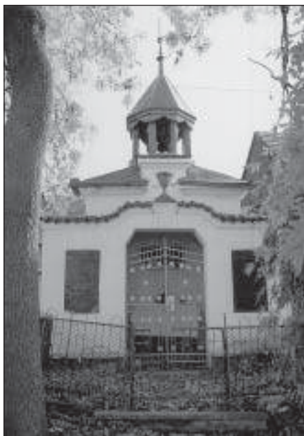
Současný stav hostokryjské kaple. Pohled ze severovýchodu a severu