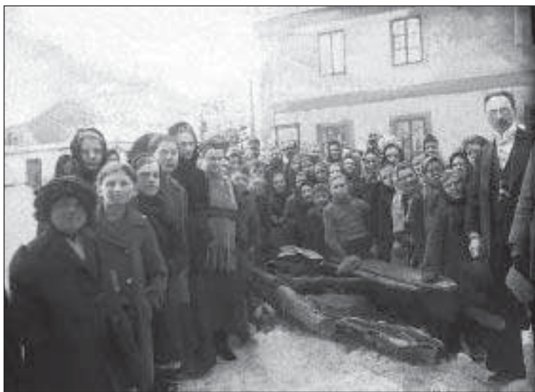
Rekvizice zvonu Ježíš před katolickým kostelem – únor 1917 (foto R. A. Jindra, MMNS, č. přír. 214/88)

Že zvony budou rekvírovány, se brzy proslýchlo. Halada zaznamenal 10. srpna 1916: „Je vyhlášeno, že budou odebíratí zvony, a sice prvně z farních kostelů, a sice třetinu.“ 110) Na konci září t. r. pak žádalo prezidium místodržitelství okresní hejmanství o předložení zprávy o zabavení zvonů, měděných střech a hromosvodů pro válečné účely. 111) Situace se