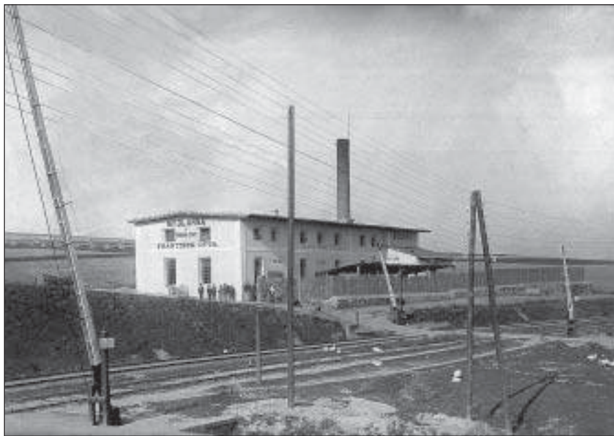
Ottova dílna postavená po r. 1900 (SOKA Rakovník)

V roce 1900 se tedy František Otta rozhodl zřídit vlastní dílnu. Ta byla prostorná, a proto nemusel šetřit místem. Před ní si dal postavit přístřešky pro uskladnění surovin a truhlářskou dílnu, ve které se vyráběly bedny. Také počet zaměstnanců se zvyšoval. V tomtéž roce zakoupil Otta, dle tržové smlouvy ze dne 1. srpna, dům na náměstí čp. 124/l od dědiců rodiny Skopovy, kam se s rodinou přestěhoval z domu čp. 117/l, v němž bydlel od svého příchodu do Rakovníka. 29)