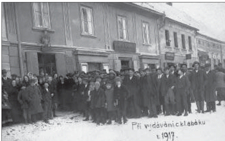
Čekání na vydávání tabáku před čp. 191 na náměstí – r. 1917