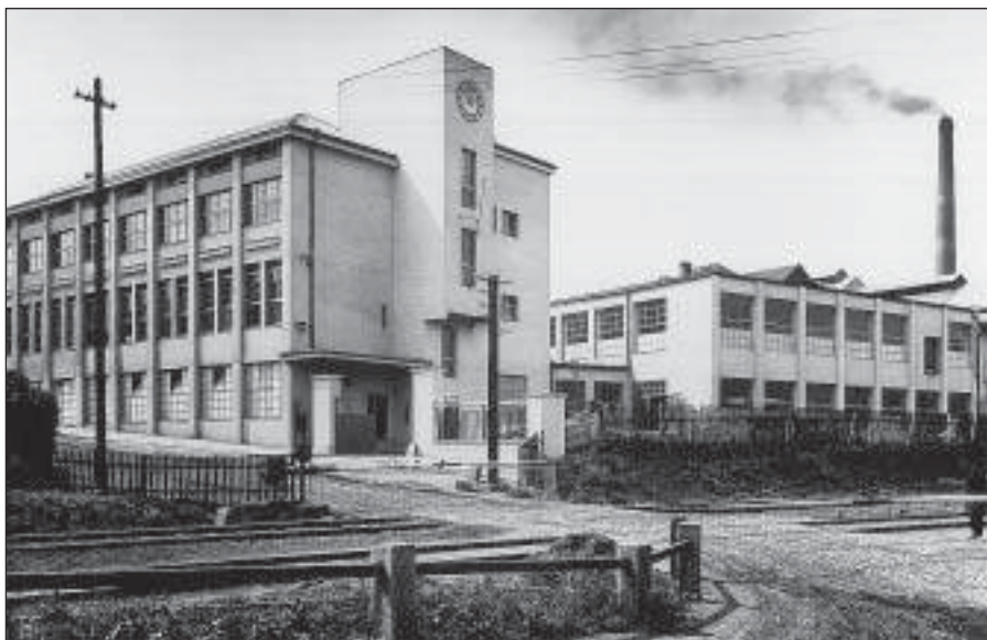
Novostavby z r. 1930 – administrativní budova s částí provozoven (SOka Rakovník)

straně dávaly ženy do stroje nezabalené kousky mýdla a na druhé vylézaly bezvadně zabalené kostky buď v kartonových krabičkách, nebo v bílých papírových obalech s natištěnou firmou a červeným rakem. Zabalené mýdlo se ihned skládalo do beden různých velikostí a váhy podle toho, kolik ho bylo zapotřebí k expedici. Navrch pod každé víko se přibalily různé pohádky, betlémy, obrázky či jiné reklamní poutače. Po naplnění dělník víko přibíl a zabezpečil jej dvěma ráfky. Další zaměstnanec odvážel takto připravené výrobky k expedici do prostoru, kde se každý den shromáždilo až přes dva tisíce beden k odeslání.