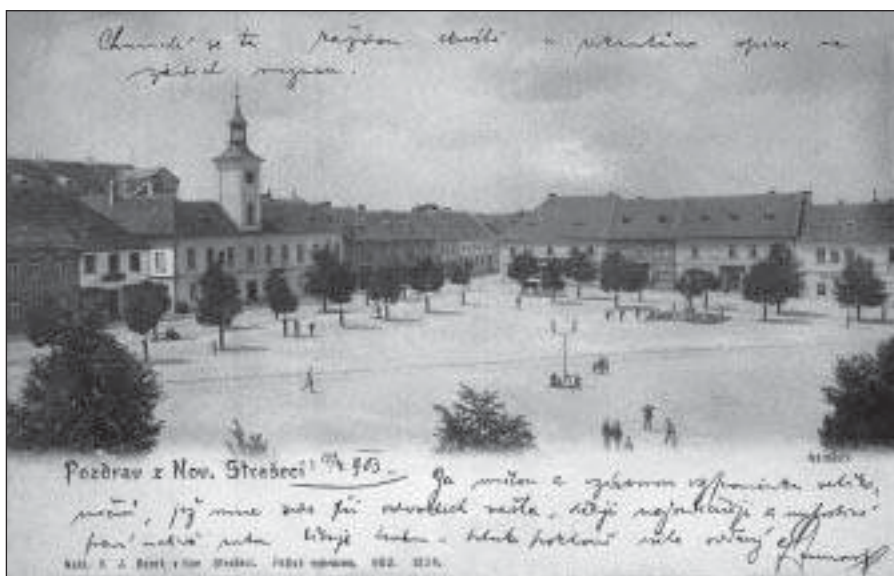
Nové Strašecí na počátku 20. století

událostech, o zabitých, raněných či zajatých vojácích. Omezilo se cestování a deformoval kulturní život. Těživě dopadla válka na školství, na denním pořádku byla vynucovaná dobročinnost, do které byly školy zapojeny. Už vyhlášení války, které přišlo v době žní, a mobilizace mužů a koní měly dopad na sklizeň roku 1914. Po přechodu na válečné hospodářství se zintenzivnila účelová výroba, průmysl se podřizoval potřebám války. V Předlitavsku se zavádělo centrální hospodářské plánování, došlo k řízení průmyslové a zemědělské výroby a k dirigování procesu spotřeby. Po celé zemi postupně vznikaly vojenské lazarety a zajatecké tábory. 17)