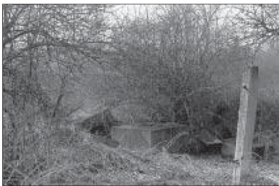
Podstavec památníku v Rakovníku – Huřvinách v roce 1978

pěkná ostuda. Fáma praví, že ji vojáci odtáhli do kasáren a zabetonovali pod tankovým rejdištěm.“ 72)