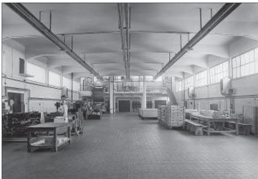
Výrobní hala margarínky v r. 1935