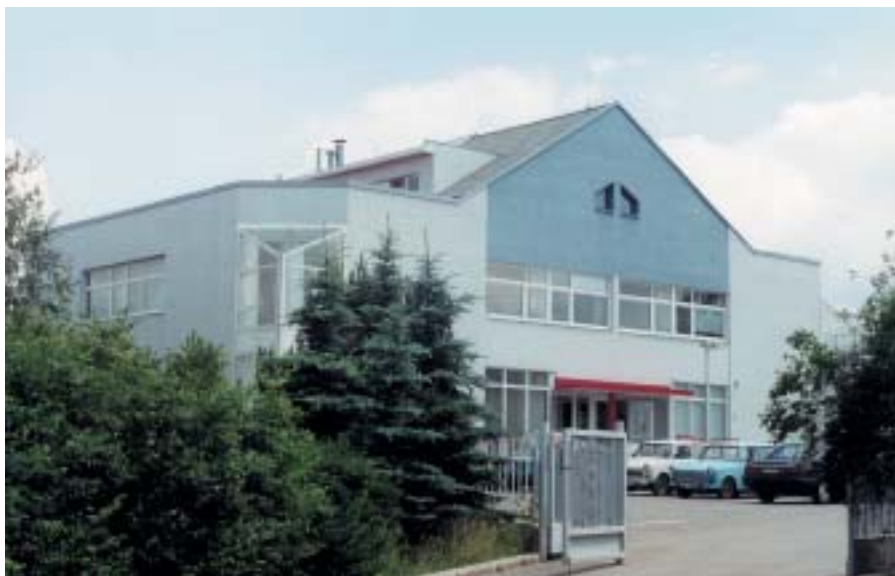
Budova Státního okresního archivu Rakovník