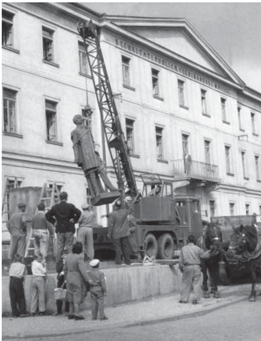
Socha Karla Havlíčka Borovského se 23. září 1959 vrací na své místo